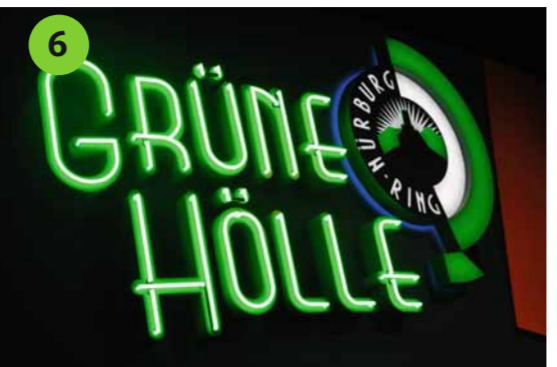
6 GRÜNE HÖLLE Grüne Hölle hautnah – ein Besuch macht die Geschichte der Nordschleife mit allen Sinnen erlebbar. Aufwendigstes Multimedia-Theater Europas.