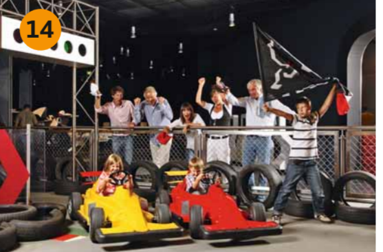
14 FORMULA JUNIOR Auch die kleinsten Gäste können hier schon erste Erfahrungen hinter dem Steuer sammeln. Als Belohnung winkt am Ende sogar der erste Führerschein mit Foto!