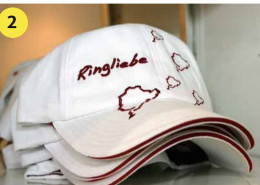
2 RING°SHOP Nehmen Sie sich ein Stück Nürburgring mit nach Hause.