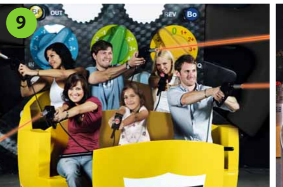
9 MOTOR MANIA Der interaktive Spaß für große und kleine Motorsportfans. Machen Sie sich auf die Reise durch eine verrückte Motorsportwelt im XXL-Format.