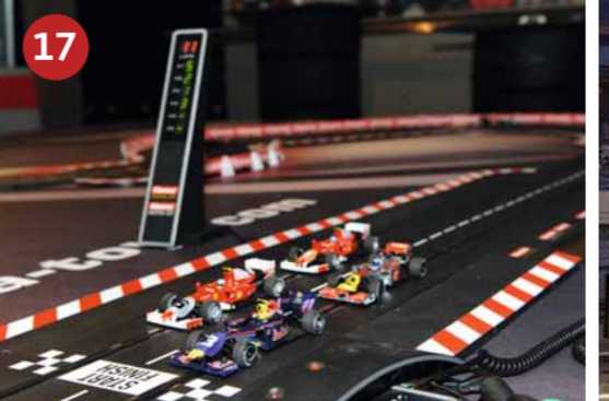
17 CARRERA Kleine und große Motorsportfans können auf der neuen Carrera DIGITAL 132-Autorennbahn die detailgetreue Nachbildung der Grand-Prix-Strecke erleben. Bei spektakulären Spurwechseln und packenden Überholmanövern ist Formel 1-Feeling garantiert.