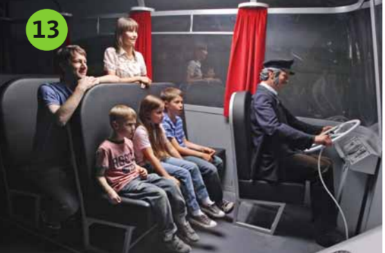
13 NÜRBUS Steigen Sie ein: Die Fahrt in einem Panoramabus aus den 50er-Jahren bietet Ihnen eine virtuelle Aussichtsfahrt durch die idyllische Eifel. Aus der Kaffeefahrt wird ein rasanter Trip über den heiligen Asphalt der Nordschleife.