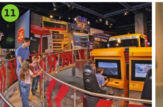
11 TRUCK-GRAND-PRIX Nehmen Sie Platz im großen Renn-Truck und lenken ihn wie beim Grand Prix über die anspruchsvolle Strecke.