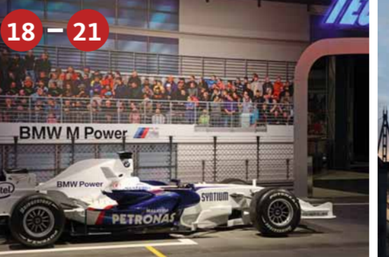
18 – 21 FORMEL-1-GRAND-PRIX Wie sieht es während der Rennen in den Boxen aus, wie werden die empfindlichen Rennwagen transportiert und welche Technik steckt in den Formel-1-Boliden? Probieren Sie im Windkanal aus, was schon kleinste Veränderungen an den Rennboliden bewirken.