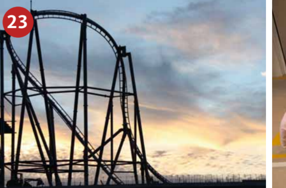
23 RING°RACER Demnächst ist es soweit: Formel-1-Feeling in der schnellsten Achterbahn Europas. Starten Sie zur Fahrt Ihres Lebens: In weniger als 2 Sekunden werden Sie auf 160 km/h beschleunigt. Starttermin auf der Website!