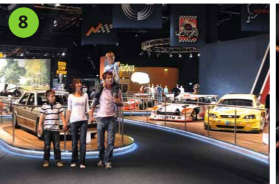
8 HISTORISCHE AUSSTELLUNG Einzigartiger Ausflug in über acht Jahrzehnte Motorsport. Wertvolle Exponate lassen nicht nur das Herz von Oldtimerfans höherschlagen.