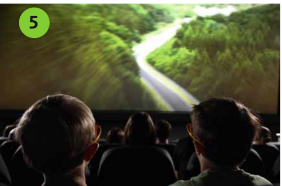
5 24H-RENNEN IN 4D Sind Sie bereit für die legendäre Jagd über die Nordschleife? Heben Sie ab in die vierte Dimension: Polarisierte Brillen machen es möglich.