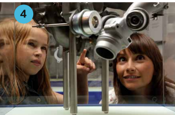
4 TEST°CENTER Gehen Sie den Geheimnissen der Autoindustrie auf den Grund – „Aha“-Erlebnisse garantiert. Die Exponate laden zum Anfassen ein.