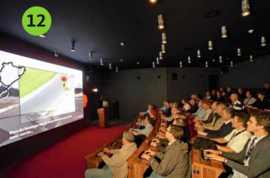
12 RING°AKADEMIE Die Herausforderung für alle, die ihr Wissen rund um den Motorsport testen wollen. Hier heißt es: „An die Buzzer ... fertig ... los!“