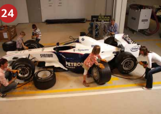
24 PIT-STOP-CHALLENGE Die Mitmachshow begleitet von Informationen rund um die Formel 1. Testen Sie Ihre Schnelligkeit beim Boxenstopp in der Pit-Stop-Show. Reifen wechseln und volltanken in Spitzengeschwindigkeit.