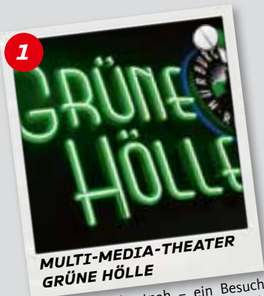
MULTI-MEDIA-THEATER GRÜNE HÖLLE

Grüne Hölle hautnah – ein Besuch macht die Geschichte der Nordschleife mit allen Sinnen erlebbar.