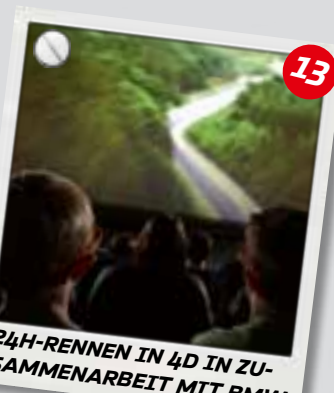
24H-RENNEN IN 4D IN ZU-SAMMENARBEIT MIT BMW

Gehe den Geheimnissen der Auto-industrie auf den Grund – „Aha“-Erlebnisse garantiert.